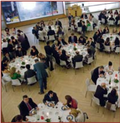
Cena de gala. El Kursaal, con sus vistas a la playa, fue un precioso escenario.